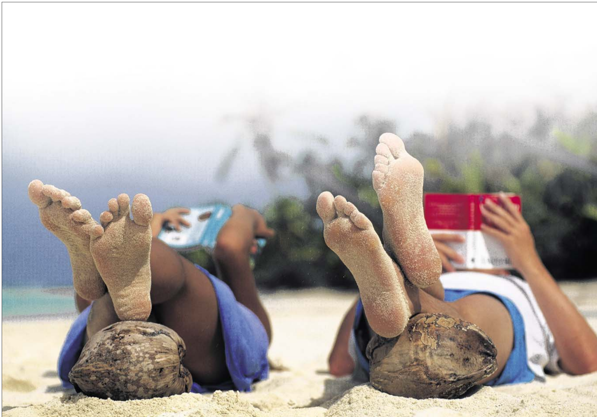
Jyllands-Posten bringer et overblik over årets 10 bedste danske erhvervsbøger, der er særdeles egnede som ferielæsning.

faser. Fra 1988 og frem til den store krise i 1999 var målet at overhale DR og etablere sig som danskernes foretrukne tv-kanal. I anden fase omkring årtusindskiftet og frem til 2008 blev privatiseringen omdrejningspunktet, der var fokus på forretningen, og det lykkedes at få ryddet op i økonomien og konsolidere forretningen omkring kerneproduktet, kommercielt tv.